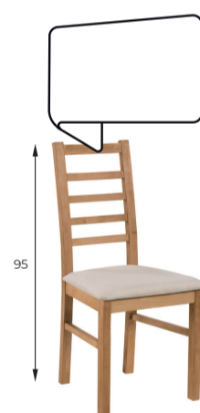
Lima A 47 / B 39 / C 95