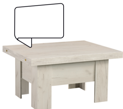
ławostół ERYK A 100-200 / B 80 / C 53-78