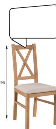
Paxos A 47 / B 39 / C 95