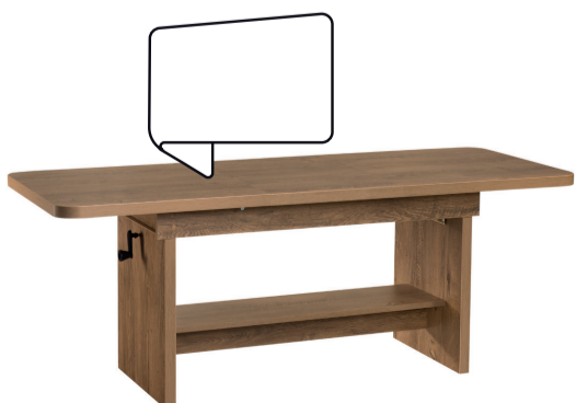
ławostół JANEK A 116-156 / B 62 / C 59-70