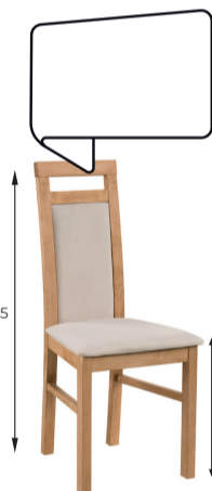
Denver A 46 / B 39 / C 95