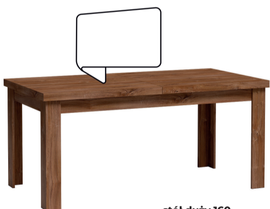
stół duży 160 A 160 / B 90 / C 75,5 wkładka 40 cm