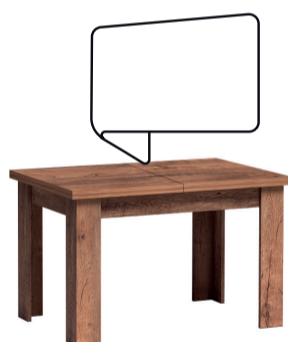
stół mały 120 A 120 / B 80 / C 75,5 wkładka 40 cm