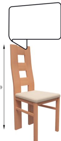
Tadeusz A 44 / B 40 / C 99